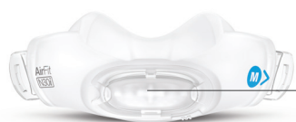
AirFit™ N30i Nasal cradle mask

Housses intégrées Composées d'un tissu doux, elles offrent au patient une expérience plus confortable.